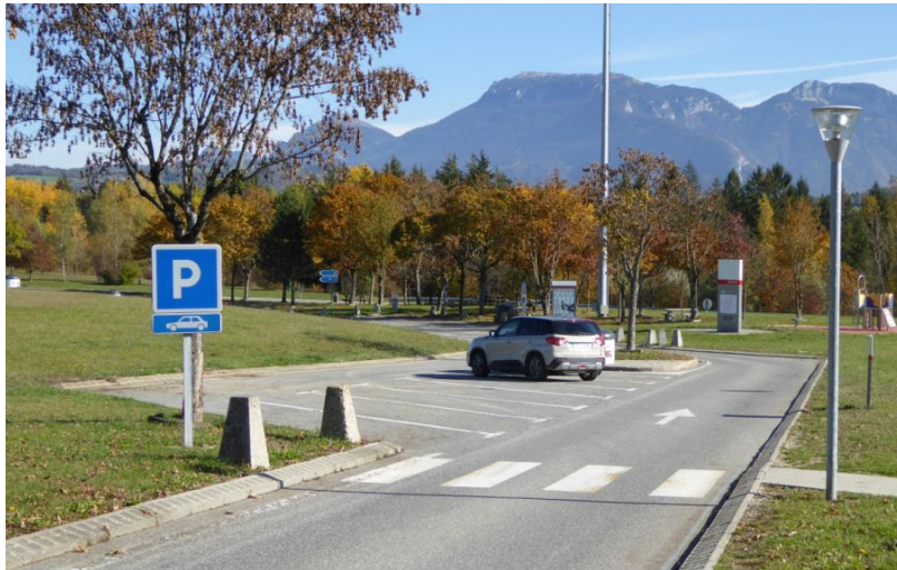
Figure 2. Exemple de conception de parc de stationnement limitant le besoin de marche arrière

Les accidents de marche arrière (touchant des piétons) liés aux manœuvres de stationnement paraissent fréquents. Il n'existe pas de moyen évident d'améliorer les conditions de visibilité lors des manœuvres de marche arrière par la conception des voies et des parcs de stationnement, mais certains aménagements pourraient probablement réduire le besoin de manœuvres de marche arrière, comme l'illustre l'exemple de la figure 2 (bien que cette disposition semble consommatrice d'espace).